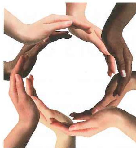
Volgens de overheid stimuleert open software de onderlinge samenwerking.

Het Platform Water Vallei en Eem is een goed voorbeeld voor de rest van Nederland, vindt ook